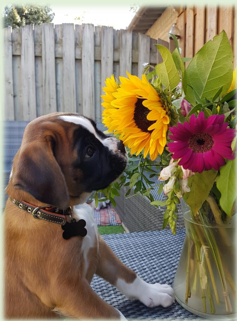
Bruno: Hé, wat is dat?

Om voor Nederland deel te kunnen nemen aan de ATIBOX WK IGP & IFH 2023 in oktober 2023, dienen zowel de eigenaar als geleider van de Boxer lid te zijn van de Nederlandse Boxer Club.