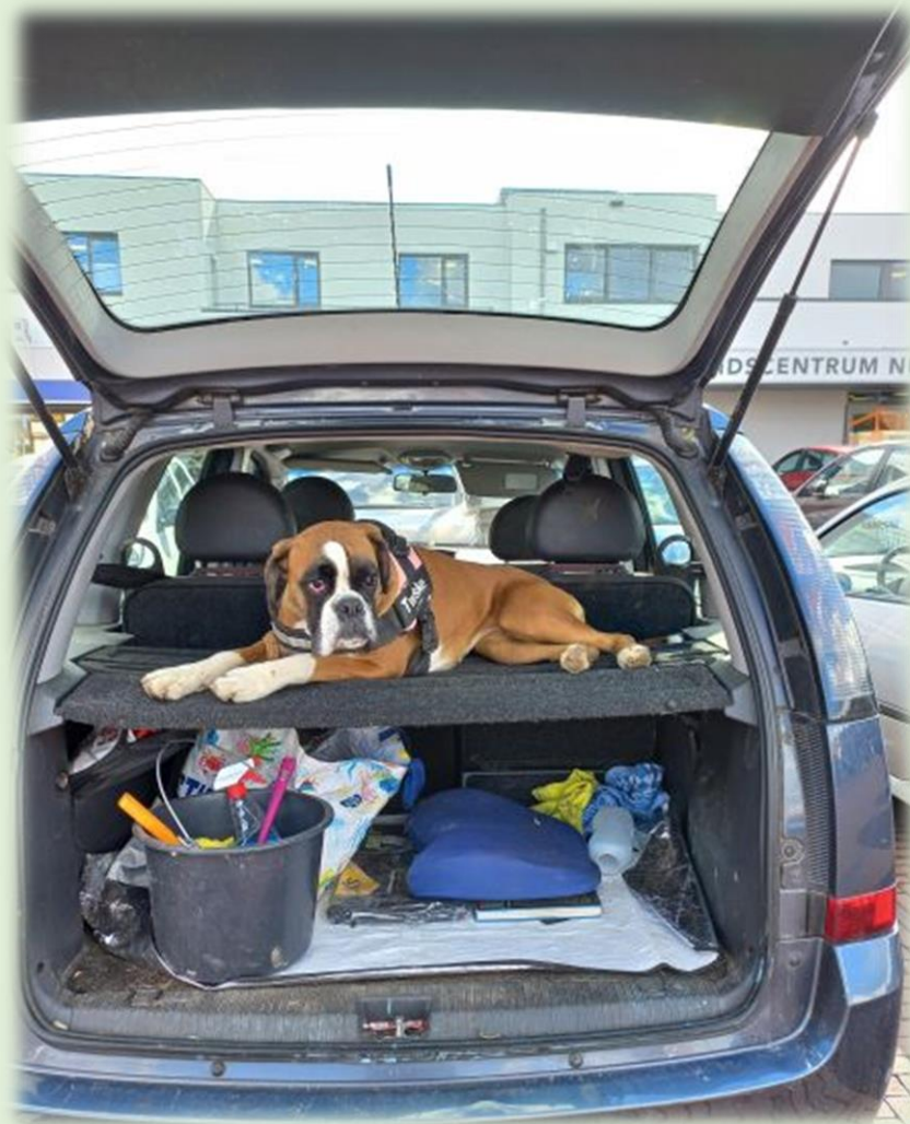
Twiske op weg naar de ALV.....?

Deze procedure is ons goed bevallen en wij willen dit dan ook handhaven.